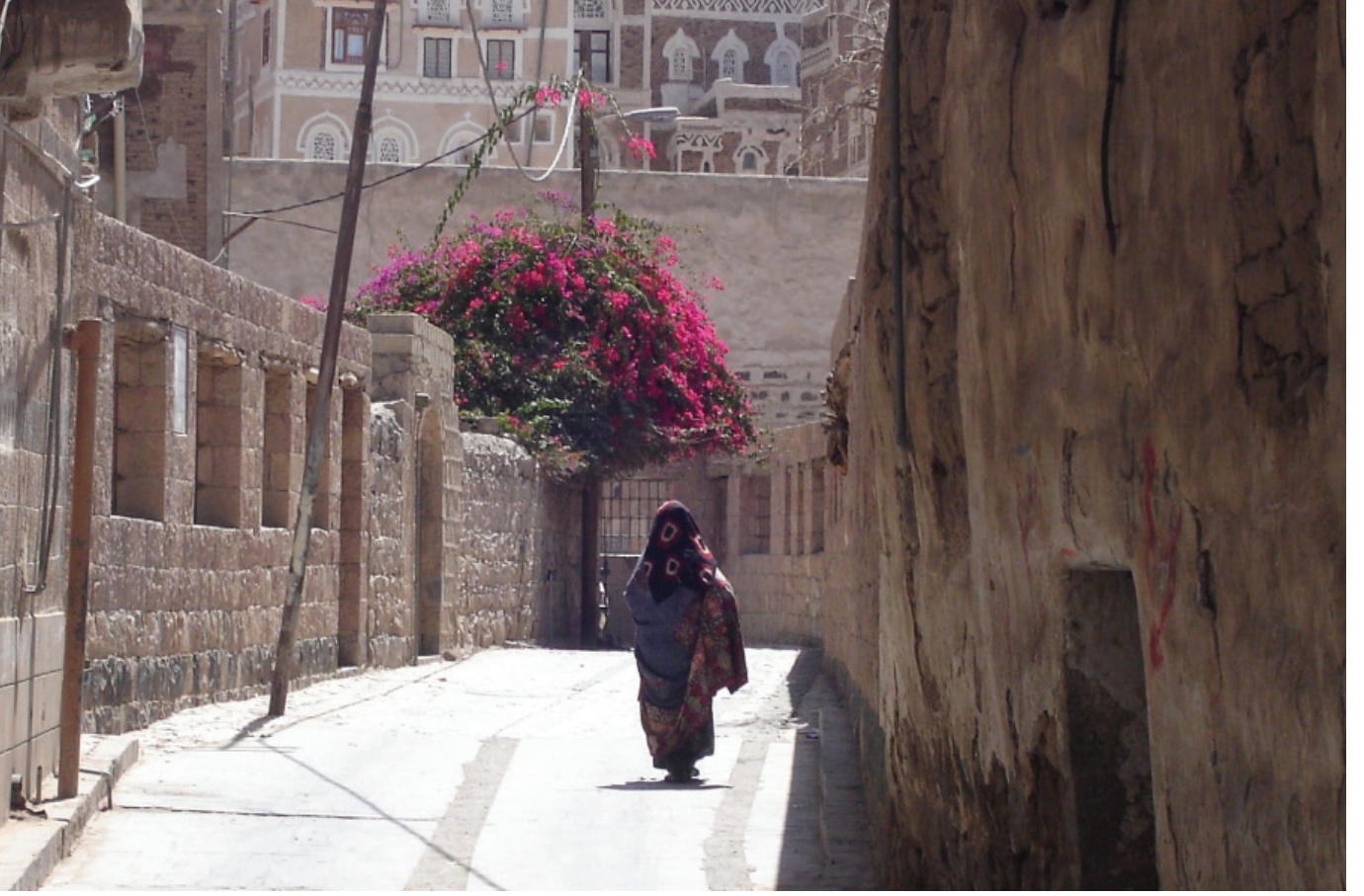
Sanaa Woman - Yemen